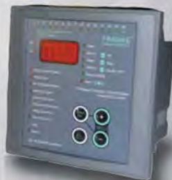
CONTROLLER 14 STEPS